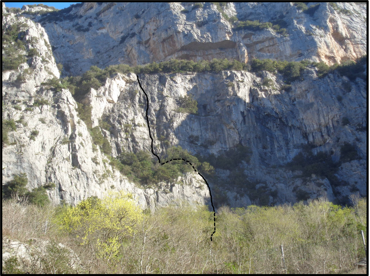
“Pietra tombale” - tracciato